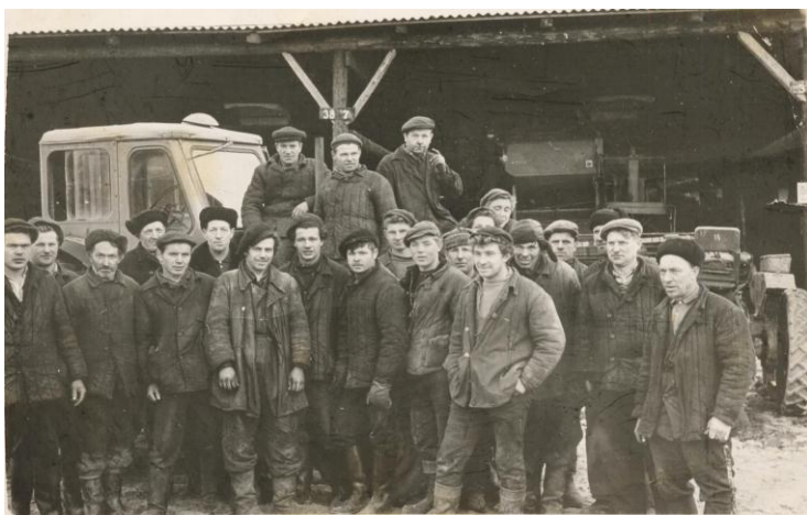
Рудненская МТС (машинно-тракторная станция), 1970-80-е гг.