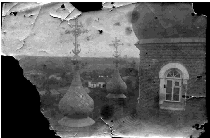
Рудно. Вид с колокольни Георгиевского храма, утраченного в годы Великой Отечественной войны.