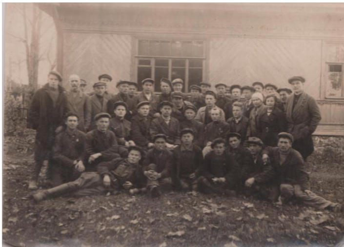
Рабочие тракторной бригады. Рудно, 25 октября 1938 г.